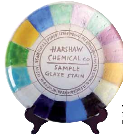
Tässä on esillä Kupittaa Saven käyttämä ”väripaletti”.