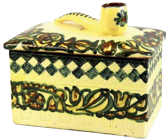
Piipputupakkarasia on Kupittaaan saviteollisuuden tuotantoa vuosilta 1918-921. Siitä löytyy massaleima, sillä niissä käytettiin erittäin harvoain singreenausta.