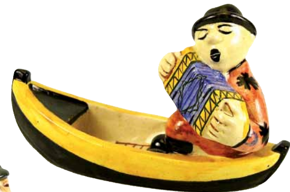
”Haitarinsoitaja” ja ”Kottikärrymies” ovat tunnettuja kupittaaalaisia, mutta niiden suunnittelijoista ei ole varmuutta. Kupittaaan tuoteluettelossa ne on nimetty tuhkakupeiksi.