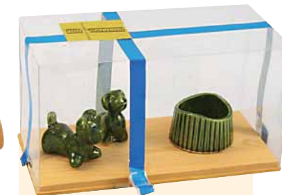
Alkuperäinen lahjapaketti, jossa on kannen teippauksena Suomen lippu.