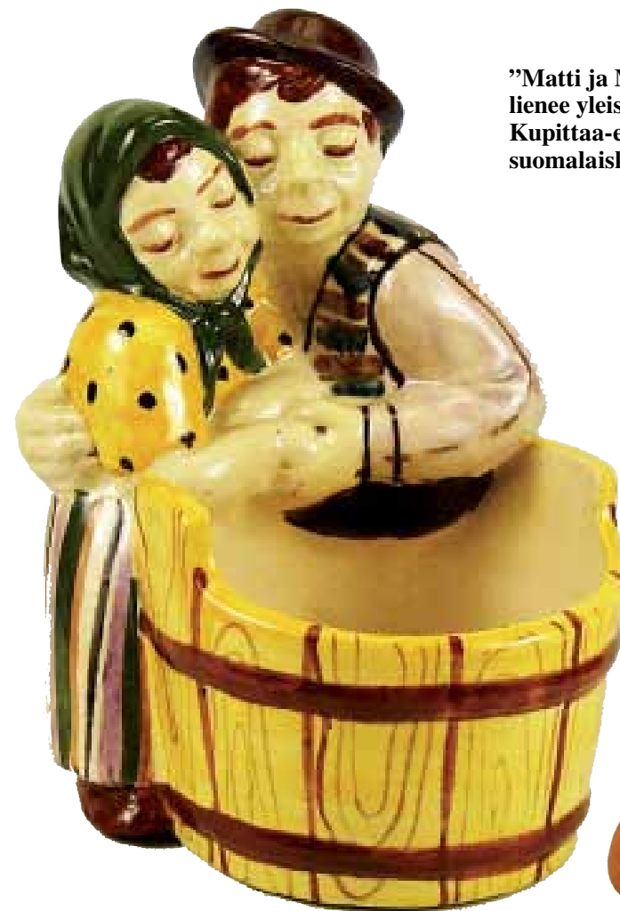
”Matti ja Maija” lienee yleisin Kupittaaa-esine suomalaiskodeissa.

Myös Arabian vahva asema ja keskeisellä paikalla sijaitseva tehtaan tontti olivat osaltaan kaa-