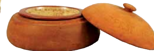
Punasavesta valmistettu voirasia.